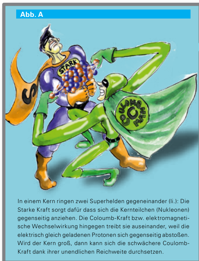
In einem Kern ringen zwei Superhelden gegeneinander (li.): Die Starke Kraft sorgt dafür dass sich die Kernteilchen (Nukleonen) gegenseitig anziehen. Die Coloumb-Kraft bzw. elektromagnetische Wechselwirkung hingegen treibt sie auseinander, weil die elektrisch gleich geladenen Protonen sich gegenseitig abstoßen. Wird der Kern groß, dann kann sich die schwächere Coulomb-Kraft dank ihrer unendlichen Reichweite durchsetzen.