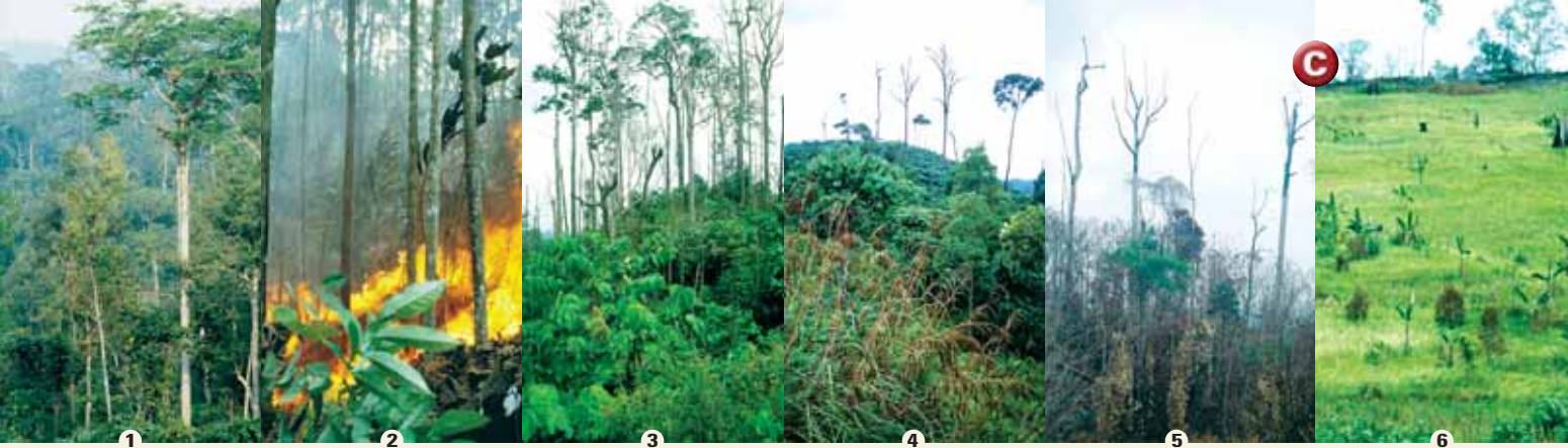
▲ 1) Selva virgen, no inflamable; 2) Incendio rasante después de tala de madera; 3) La misma selva tres años después; 4) Estado de la regeneración una década después; 5) Impacto de un segundo fuego; 6) Fase final de destrucción del bosque por tala de madera e incendios naturales: el producto es una sabana de gramíneas, improductiva y pobre en especies.