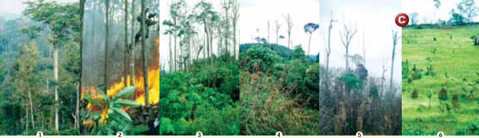
▲ 1) Unberührter, nicht brennbarer Regenwald; 2) Bodenfeuer nach Holzeinschlag; 3) Der gleiche Wald drei Jahre später; 4) Zustand der Regeneration nach einem Jahrzehnt; 5) Auswirkungen eines zweiten Feuers; 6) Schlussphase der Waldzerstörung durch Holzeinschlag und Wildfeuer – es ist eine unproduktive und artenarme Gras-Savanne entstanden.

tropische Savannen aus. Ihre Fläche beträgt weltweit mehr als zwei Milliarden Hektar. Davon gehen jedes Jahr schätzungsweise mehrere hundert Millionen Hektar in Flammen auf. Es sind damit die größten Flächen, die regelmäßig abgebrannt werden, und dabei gelangen beträchtliche Mengen von Kohlenstoff in die Atmosphäre. Da die Savannenvegetation aber schnell nachwächst, ist die Kohlenstoffbilanz für stabile Savannenökosysteme ausgeglichen.