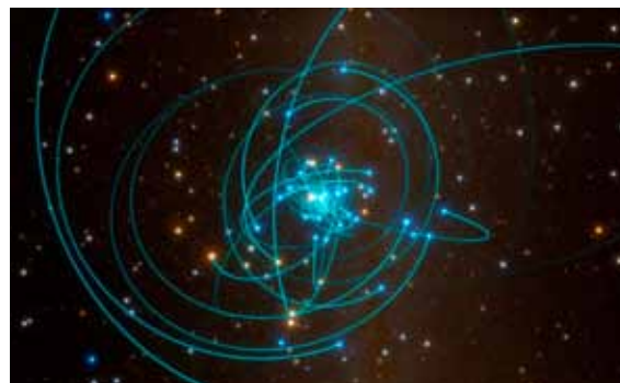
Abb. C Galaktischer Bienenschwarm

Tief im galaktischen Zentrum warten noch mehr spannende Entdeckungen auf die Astronomen. Diese haben schon vor einigen Jahren damit begonnen, die weitere Umgebung des schwarzen Lochs zu studieren. Denn dort ziehen jede Menge Sterne ihre Bahnen ( Abb. C ). Aus dem Vergleich von mehreren, zu unterschiedlichen Zeitpunkten gewonnenen scharfen Aufnahmen mit neuen Beobachtungstechniken bestimmten die Forscher die Eigenbewegungen der Sterne sowie mittels des Dopplereffekts deren Ra-